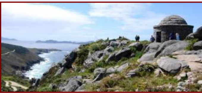
O castro de OFacho, en Cangas, consagrado ao deus Berobreo.

“Na Idade de Ferro, no noroeste de Iberia circulaban relatos de tipo mítico concernentes aos temas habituais nas mitoloxías, como son a concepción xeral do mundo e da vida humana cunha reflexión específica sobre o Máis aló; tamén se incluíría a xenealoxía dos deuses e a especificación dos seus atributos e