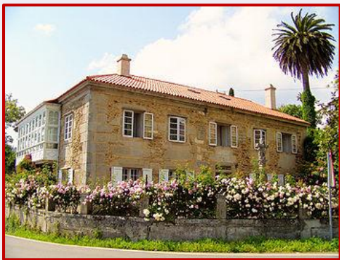
Casa natal de pondal, en Ponteceso.

No ano 1857, seguindo os parámetros literarios do poeta portugués Luis Vaz de Camões, apareceron os primeiros versos de Os Eoas e, ao ano seguinte, viu a luz a primeira versión de La Campana d'Anllóns , publicada na edición do 14 de febreiro no xornal pontevedrés El País.