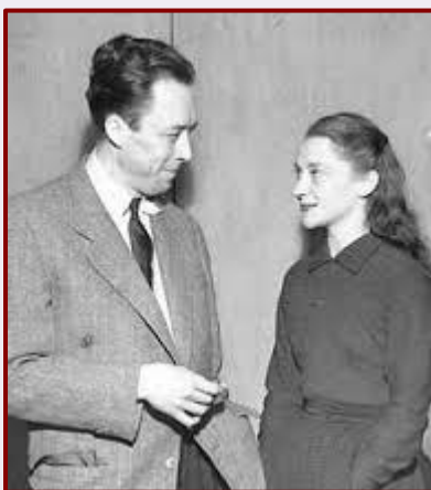
María Casares con Albert Camus

teatro de texto fronte ás grandes montaxes. María convértese tamén na protagonista de " O malentendido ", a primeira peza teatral de quen será o seu amante durante anos, Albert Camus. Con apenas vinte anos, comeza a ser coñecida e admirada en todo París, tendo que rexeitar a numerosos pretendentes. Entra no cinema cun papel secundario nunha película de Marcel Carné, " Os nenos do paraíso " e pouco despois, en 1944 protagoniza " As damas do Bosque de Boloña " de Robert Bresson. Acada o papel protagonista na estrea de " Estado