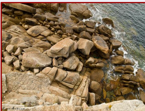
Berce da santa

Nesta península áchase a ermida dedicada a Nosa Señora da Area, pero que todo o mundo coñece como da Lanzada. A entrada principal da ermida da Lanzada mira cara ao mar. Poucos metros máis adiante hai unhas escaleiras que baixan ata as rochas. Alí encóntrase o « berce da Santa », un conxunto de pedras de formación natural que teñen forma de cama e que constitúen unha peza imprescindible no ritual de fecundidade. O outro elemento deste son as propias ondas da praia.