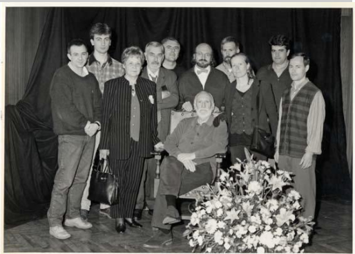
Na homenaxe nacional que lle tributou a ASPG en Compostela en 1999