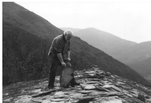
Arranxando o tellado na súa casa do Courel

de España xunto coas series de poemas «Primera verdad y tiempo con nombres» e «Elegías del Courel».