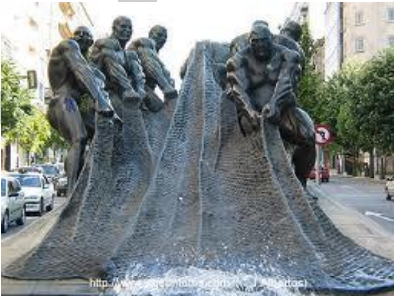
Os redeiros, Vigo