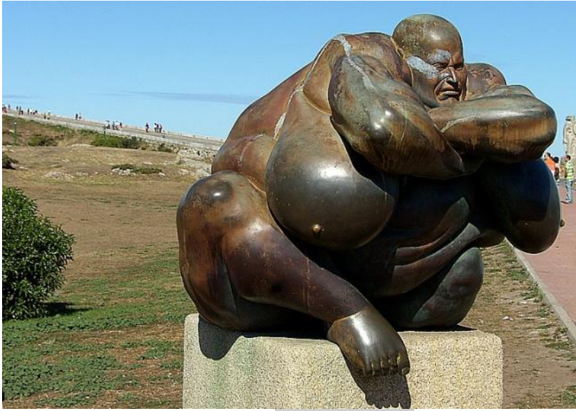
O vixiante, A Coruña