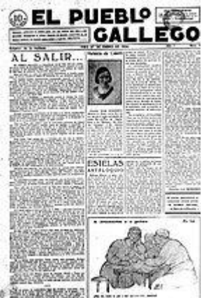
Castelao publicou en El Pueblo Gallego

En 1920, Vicente Risco, Otero Pedrayo e outros fundan a revista Nós , da que Castelao foi Director Artístico a partir de marzo de 1923. Ó redor de Nós xermolou a vida política e cultural de Galiza ata a súa desaparición en 1936. En marzo dese ano 1920 inaugúrase na Coruña a súa exposición Nós , con 49 debuxos e un autorretrato; tamén se presentou en Madrid e en Ourense e, xa en 1921 e seguintes, noutras cidades galegas e mais en Barcelona. Esta exposición foi publicada como álbum en 1931. Á parte do que representou para el mesmo desde o punto de vista artístico e de recoñecemento público, a Exposición Nós deu pé a numerosas conferencias e actos culturais ó seu redor nas cidades onde se presentou. No caso da presentación en Santiago, en 1924, serviu de feito para o recoñecemento oficial do Seminario de Estudos