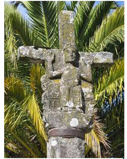
Castelao estudou as cruces de pedra bretoas e galegas, como esta, o cruceiro mais antigo de Galiza, en Melide.

É na breve estancia en Francia cando comezan a manifestarse os primeiros síntomas da enfermidade cancerosa que sufría, como unha afección ó fígado que o tivo na cama unhas cantas semanas. Xa na Arxentina, Castelao retomou a actividade política e participou en numerosos actos públicos, como o coñecido