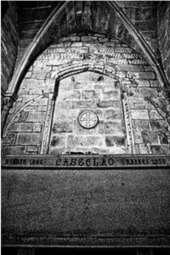
Tumba de Castelao no Panteón de galegos ilustres

O mesmo día en que chegan os restos de Castelao, concédeselle a título póstumo