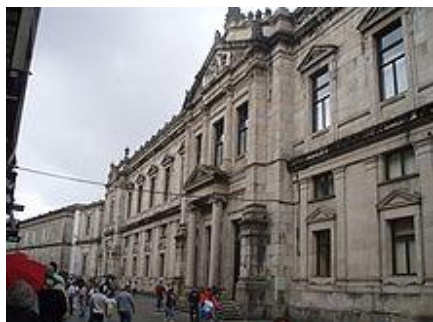
Facultade de medicina da Universidade de Santiago de Compostela