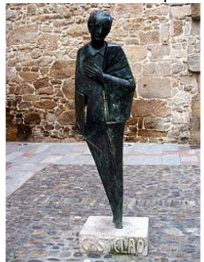
Estatua de Castelao en Ourense

Para el, Hespaña non era outra cousa que unha entidade sociolóxica que abranguía toda a Península Ibérica. Por isto mesmo, afirma en varias ocasións que Portugal é Hespaña, e apóiase nas verbas