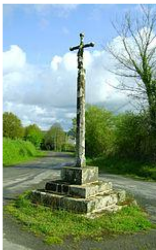
En 1929, Castelao marcha á Bretaña para estudar os cruceiros, como este de Croix de Pennavern.

Entre 1924 e 1925 publica no diario Galicia (fundado en 1922 e dirixido por Paz Andrade) unha viñeta diaria e algúns textos. En 1926 pecha Galicia e publica as súas viñetas en Faro de Vigo e os textos, as cousas , en El Pueblo Gallego . En total, entre 1926 e 1927 publica 36 cousas , que se repiten noutros medios (como na