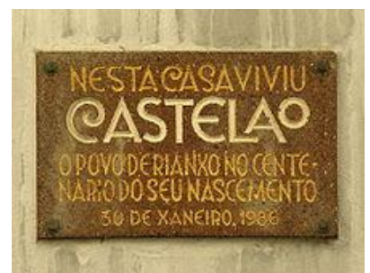
Inscripción na casa de Castelao

Na casa e na escola chamárono sempre Daniel, non Alfonso como, por iniciativa propia,