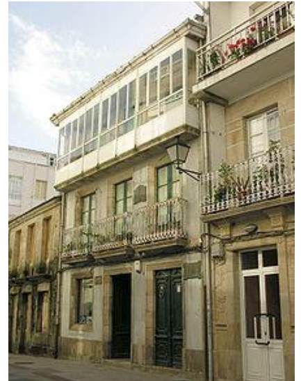
Casa de Castelao en Rianxo