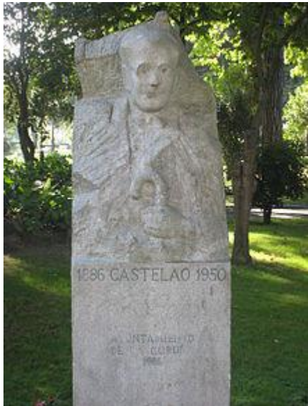
Busto de castelao na Coruña

O interese por un pacto trinacional foi medrando, uníndose o PNV, e entrando en conversas, que frutificarían no Pacto de Compostela ou asinado no local do Seminario de Estudos Galegos o 25