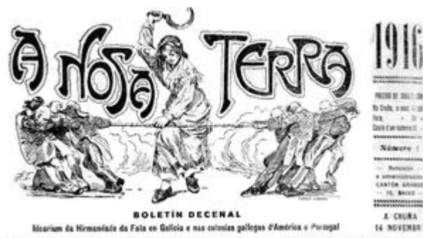
Castelao foi un colaborador habitual do xornal A Nosa Terra , voceiro das Irmandades da Fala e, mais tarde, do Partido galeguista

En 1919 nace o Castelao narrador, coa publicación de catro relatos breves na