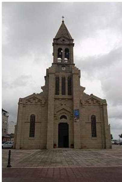
Igrexa de Santo Paio, A Estrada.